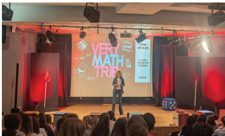
Début du spectacle de Very Maths Trip avec les classes de seconde

L'objectif principal de Very Math Trip est clair : démontrer les fausses croyances autour des maths. Contrairement à ce que certains pensent, cette discipline n'est pas réservée "aux bons élèves" ou "aux génies du calcul". Cette action vise à rendre les mathématiques plus accessibles, moins intimidantes, et surtout plus proches du quotidien. Pour M. Lemaresh-