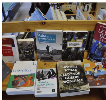
Documentation au CDI.

Pour nous, élèves de seconde, notre ressenti sur cette expérience est que nous trouvons que les cours peuvent parfois être ennuyeux et long, mais d'autres fois ils peuvent être très intéressants. Le jour où nous étions présents, nous avons trouvé que le cours était intéressant, car nous avons parlé du procès de Nuremberg. Ce que nous avons pu observer, c'est que les élèves participants sont tous très motivés ! La prépa demande