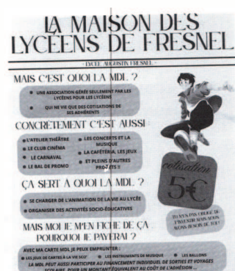
Flyer présentant les activités et les services de la MDL de notre lycée.

S'engager dans ce projet incite des élèves à prendre des initiatives afin d'organiser des activités comme des fêtes de fin d'année, des activités culturelles dans différents