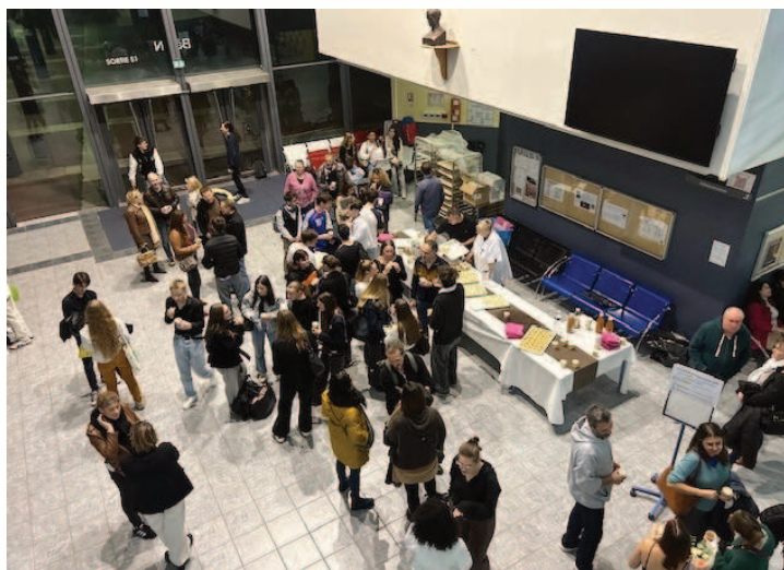
Le buffet après la cérémonie dans le hall