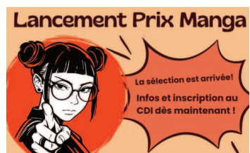
Affiche du prix manga inter-lycées 2025-26