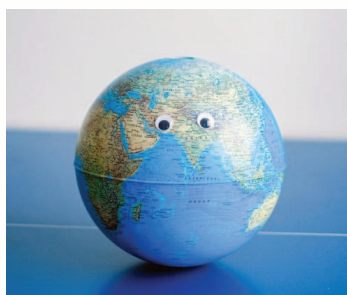
Protégeons notre planète

moutons se baladent devant le lycée et tondent l'herbe. Fini la tondeuse bruyante et polluante : eux font le boulot, et, en bonus, ils sont adorables.